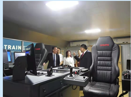
悉尼科大副校长参观我校实验室