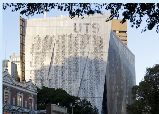
悉尼科技大学建筑外景