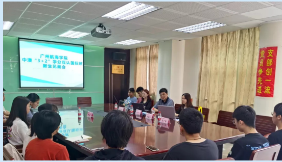
中澳国际班新生见面会