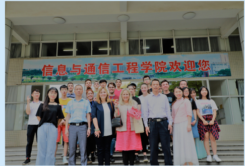
信通学院中外文化交流活动