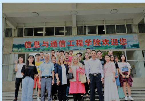
信通学院中外文化交流活动