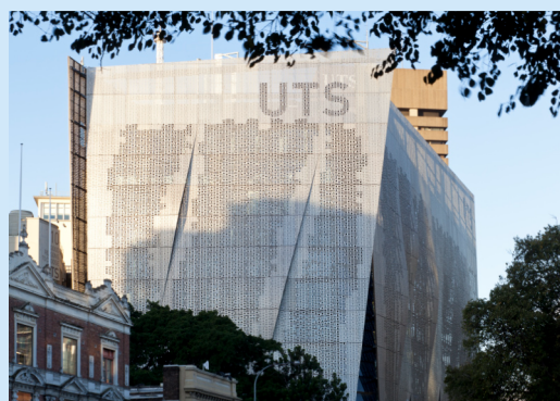
悉尼科技大学建筑外景