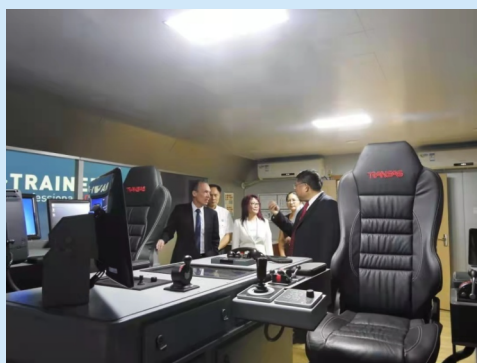
悉尼科大副校长参观我校实验室