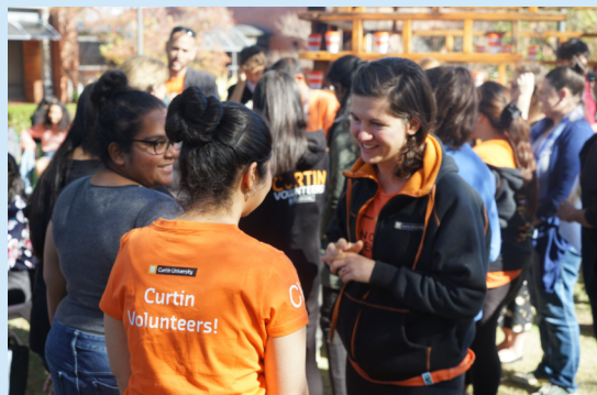
科廷大学学生活动