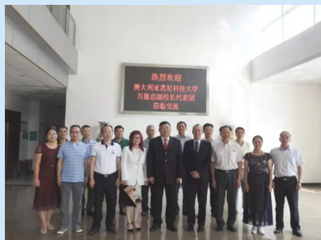
悉尼科技大学副校长一行来访