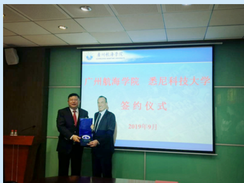
广航与悉尼科技大学签约仪式