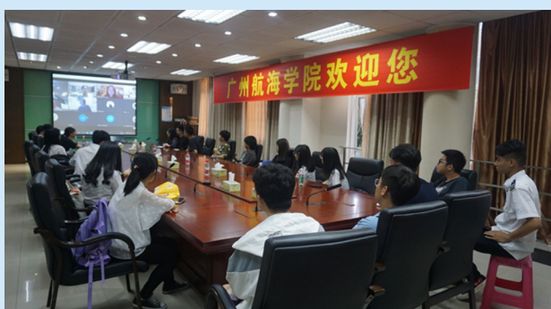
与澳方合作大学线上学术交流