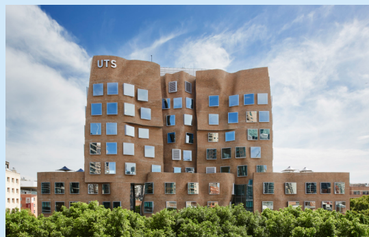
悉尼科技大学商学院