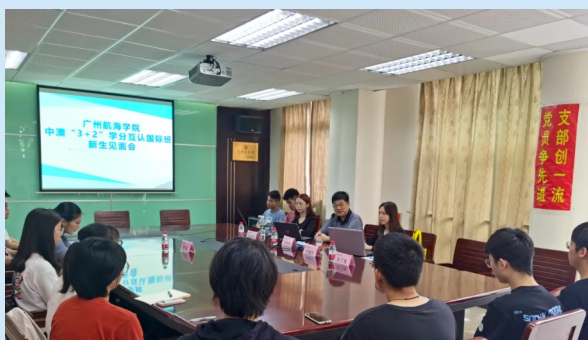
中澳国际班新生见面会